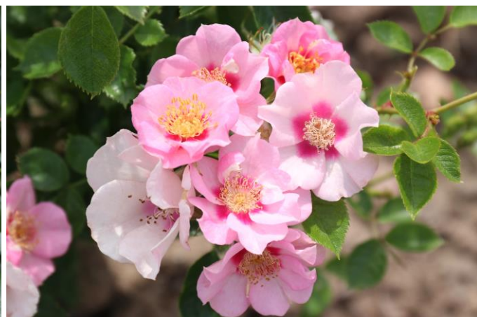
'See YOU Baby'