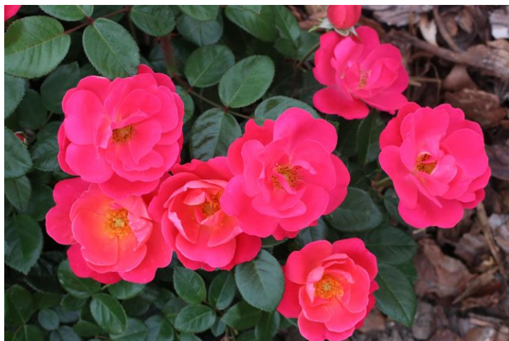
'Pink Meidiland'

De perkroos 'Hot Pink MEIDILAND'® (Meilland, 2025) blinkt uit door zijn compacte groei. De ontluikende bladeren hebben een rode schijn en worden blinkend donkergroen. Halfgevulde komvormige roosrode bloemen staan in dichte trossen. Deze variëteit heeft een sterke tweede bloei en wordt gemiddeld 60 cm hoog en breed.