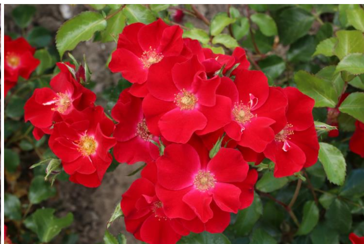
'Scarlet Drift'

De lage struikroos 'Scarlet DRIFT'® (Meilland, 2024) groeit bossig en heeft weinig stekels. De ontluikende bladeren hebben een rode schijn en worden blinkend middengroen. Daarboven vormen de enkele bloemen in dichte trossen een middenrood bloementapijt. Deze roos schoont goed, is insectvriendelijk en maakt in verhouding dikke bottels. Ze wordt 50 cm hoog en 60 cm breed.