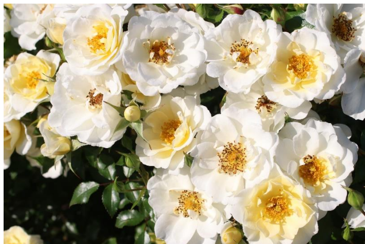
'Bienenweide Ivory'

De lage heester ' Bienenweide® Ivory ' (Tantau, 2021) groeit bossig met middengroene kleine glanzende bladeren, die goed gezond blijven tot ver in de herfst. Normaal wordt 'Bienenweide Ivory' 60 cm hoog en breed. Ze heeft bloeirijke takken met trossen van halfgevulde geelwitte bloemen. Die trossen staan op opvallend rode stelen. De bloemen blijven lang en hebben een heel goede regentolerantie. Donkergele meeldraden met een bruine was lokken insecten en verlenen een warme kleur aan de bloemen. In de herfst sieren dikke ronde bottels de struik.