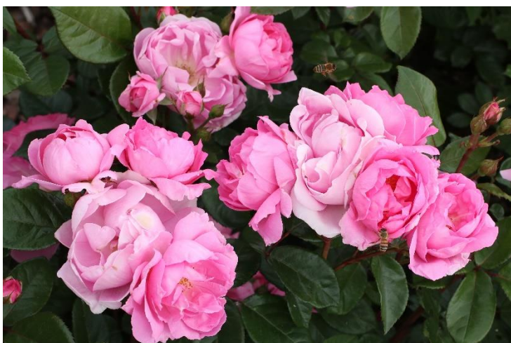
'Europa Donna'

De compacte trosroos ' Europa Donna® ' (Kordes, 2025) heeft haast stekelloze takken. De jonge bladeren zijn donkerrood en verouderen naar middengroen. De halfgevulde bloemen lijken op die van pioenen, waardoor de plant romantisch oogt. Ook deze variëteit lokt insecten en toont vanaf het einde van de zomer mooie bottels, die de struik heel de winter sieren. De struik wordt ca. 90 cm hoog en 70 cm breed.