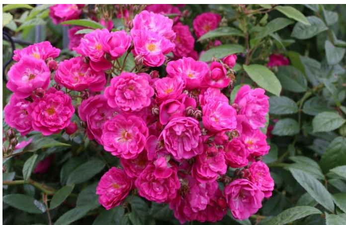
'Perfumy Siluetta'

'Perfumy Siluetta'® (Kordes, 2022) is een lage liaanroos met lange buigzame takken. Het lichtglanzend loof is middengroen. Van onder tot boven blijft ze helemaal in blad staan en haar roosvioletten bloemen tonen. De halfgevulde kleine bloempjes staan in dichte trossen en verspreiden een aangename geur. Deze klimroos bloeit nogmaals goed op het einde van de zomer. Ze wordt 180 cm hoog, is insectvriendelijk en heeft in de herfst veel kleine botteltjes.