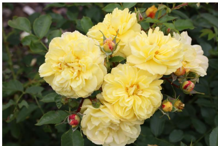
'Golden Fleece'

De lage struikroos ' Golden Fleece® ' (Kordes, 2026) groeit breed en bossig uit. De nieuwe bloemknoppen hebben een rode schijn en de gevulde heldergele bloemen contrasteren goed met de middengroene licht glanzende bladeren. Ze is goed zelfreinigend en de tweede bloeiperiode volgt snel na de eerste. Het is een waardevolle aanvulling van het aanbod van de firma Kordes, vooral omdat er slechts weinig gele bodembedekkende rozen zijn. Ook deze variëteit lokt insecten en toont vanaf het einde van de zomer mooie bottels, die de struik heel de winter sieren. De struik wordt ca. 70 cm hoog en 90 cm breed.